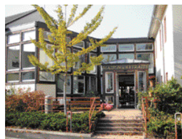
La maison de retraite de Rhinau.

Afin de continuer ces efforts, la réflexion autour de l'organisation d'une 5 ème branche de la Sécurité sociale se poursuit également.