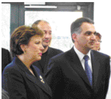
Roselyne Bachelot, Ministre de la santé au CHS d'Erstein le 30 mai 2008.