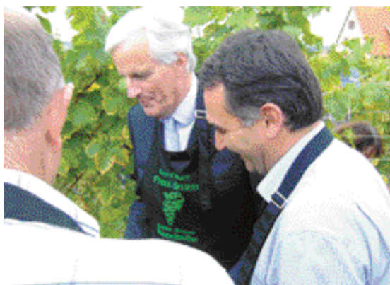
Michel Barnier, Ministre de l'Agriculture, et Antoine Herth vendangeant à Blienschwiller.

L'apparition répétée de la chrysmèle du maïs dans notre région, la réforme de l'Organisation commune des marchés (OCM) viti-vinicole engagée au niveau européen ou encore la concurrence déloyale subie par nos maraîchers locaux sont quelques exemples des sujets qui préoccupent les entreprises agricoles de la circonscription.